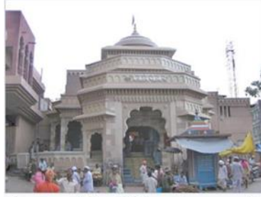
पंढरपूरच्या विठ्ठल मंदिराच्या द्वाराजवळ असलेली चोखामेळा यांची समाधी तथा मंदिर

संत चोखामेळा (चोखोबा) हे यादव काळातील नामदेवांच्या संतमेळ्यातील वारकरी संप्रदायातील कवी होते. संत चोखोबा हे एक, संत ज्ञानेश्वरांच्या प्रभावळीतले संत होते. संत नामदेव हे त्यांचे गुरू होत. पहिल्या दलित कवीपैकी एक असणारे संत चोखामेळा तत्कालीन सामाजिक विषमतेमुळे होरपळून निघाले ते शुद्र-अतिशुद्र, गावगाडा, समाज जीवन, भौतिक व्यवहार, उच्चनीचता व वर्णव्यवस्था यांच्या विळख्यात अडकले. त्यांच्या प्रभावी अभंगांद्वारे संत चोखामेळा यांनी समानता, करुणा आणि सन्मानाचे संदेश दिले, न्याय्य आणि सर्वसमावेशक समाजाचा पुरस्कार केला. त्यांचे समाधीमंदिर पंढरपूर येथे आढळून येते.