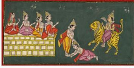
The siblings Muktabai, Sopan, Jñāneśvar and Nivruttinath seated on the flying wall greet Changdev Maharaj seated on a tiger. In the centre, Changdev bows to Jñāneśvar.

११. संत सोपान : (इ.स. १२७४ ते १२९७ सुमारे)