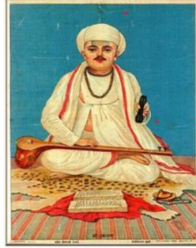
संत तुकाराम महाराज

२. संत तुकाराम महाराज: (इ. स. १६०८ ते १६५० सुमारे)