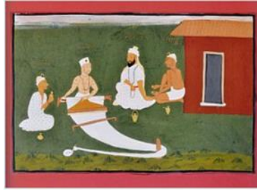
Namdev (second from right) with other bhagats of Hinduism: Ravidas, Kabir and Pipa.

संत नामदेव यांनी भक्ती चळवळीवर अमिट छाप सोडली. ते एक संत-कवी होते जे त्यांच्या दैवी भक्तीसाठी आदरणीय होते. नामदेवांच्या शिकवणुकीत जात-पात किंवा धर्माचा विचार न करता प्रेम आणि ईश्वराला शरण जाण्याच्या मार्गावर जोर देण्यात आला. ते मराठी भाषांमधील सर्वाधिक जुन्या काळातील कवींपैकी एक होते. त्यांनी ब्रज भाषांमध्येही काव्ये रचली. शिखांच्या गुरू ग्रंथसाहिबातले चरित्रकार, आत्मचरित्रकार आणि अभंग (भक्तीगीते) 'कीर्तना'च्या माध्यमातून भागवत धर्म पंजाबपर्यंत नेणारे आद्य प्रचारक होते.