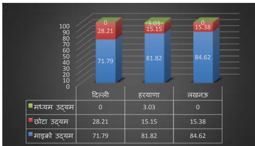
चित्र :4.2 विनिर्माण क्षेत्र में उद्यमों का वितरण

85 कारखानों में से 77.64 को सूक्ष्म-उद्यम के रूप में 21.18, को छोटे-उद्यम के रूप में और 1.18 को मध्यम आकार के रूप में वर्गीकृत किया गया है। दिल्ली में विनिर्माण सूक्ष्म और लघु-स्तरीय व्यवसायों (क्रमशः 71.79 और 28.21 प्रतिशत) का प्रभुत्व है। सूक्ष्म उद्यम हरियाणा के निर्माताओं का 81.82 प्रतिशत बनाते हैं, जबकि छोटे और मध्यम आकार के