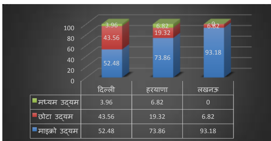
चित्र :4.3 सेवा क्षेत्र में उद्यमों का वितरण

233 सेवा इकाइयों में से अड़सठ दशमलव दो चार प्रतिशत (68.24) को क्रमशः सूक्ष्म, लघु, या मध्यम